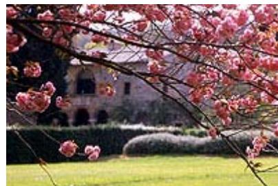
Figure 3 e 4 La Chiesa di San Liberato

La chiesa ancora oggi funge da fulcro all'intera tenuta disegnata negli anni sessanta dal famoso paesaggista inglese Russel Page; architetto tra i più importanti ed influenti che lavorarono in Italia nel novecento. Tra i suoi progetti più famosi figurano: il giardino Agnelli di "Villar Perosa", la "Mandriana" di Tor San Lorenzo e la "Mortella" ad Ischia. Ed è proprio sfogliando l'unico libro che ha scritto Page, ovvero " The education of a gardener ", che scopriamo un tesoro di idee, consigli pratici ed utilissime informazioni.