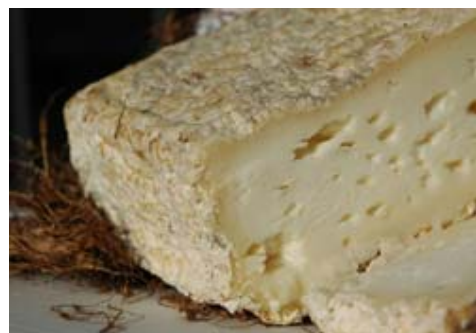
Figura 11 Il caciofiore

Il formaggio così ottenuto ha la forma di una mattonella di circa dieci centimetri di lato, alta circa cinque, con peso intorno ai cinquecento grammi. La crosta edibile, grinzosa e giallognola racchiude una