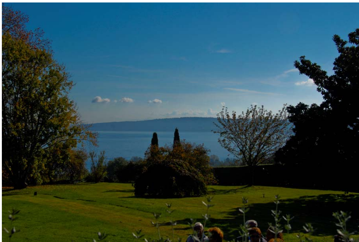
Figura 6 La vista del lago

Inoltre Russel Page, per volere dei committenti, aggiunse colore e profumi in quantità. Quindi, dopo quarantacinque anni abbiamo più di mille duecento rose, numerosi viburnum, garrya, spiree, diciassette specie di pinus, sette di magnolia, settantatre di camelia, una svariata collezione di rododendri ed aceri.