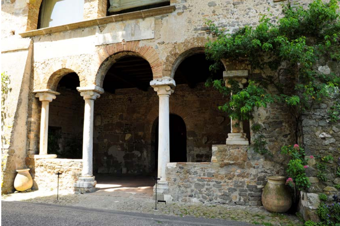
Figura 2 La Chiesa di San Liberato

Dell'antica città romana, stazione di posta, rimangono numerosi reperti utilizzati nelle epoche successive per costruirvi intorno all'IX secolo una piccola chiesa dotata di torre campanaria. Il ricco reimpiego di materiali di età romana è dimostrato tra l'altro da una lastra in marmo bianco con inciso il nome "villa Pausilypon", della liberta Mettia Pedone. Questi materiali provengono plausibilmente dalle rovine dell'adiacente Forum Clodii.