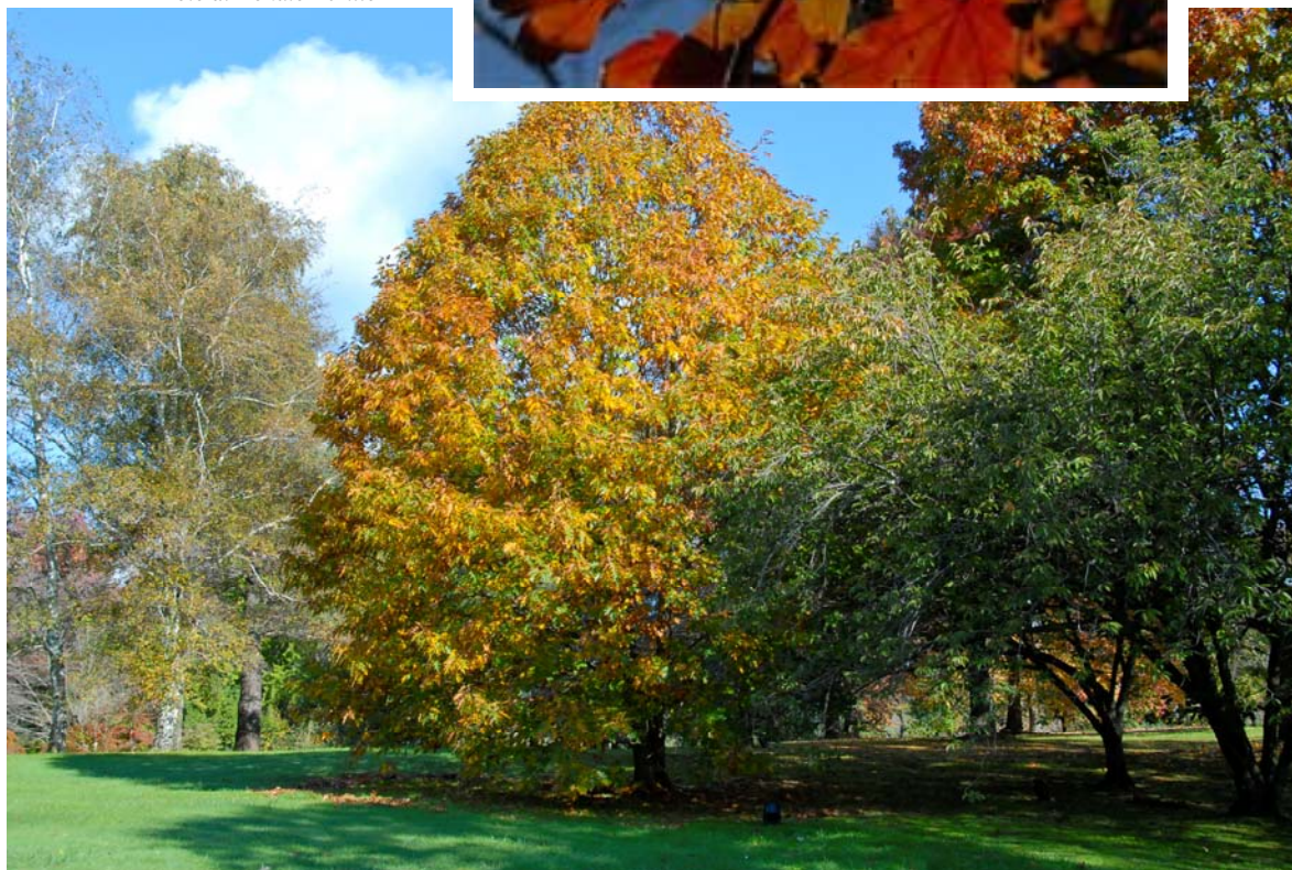
Figura 10 Particolare del parco

La Tenuta di San Liberato è senz'altro uno dei suoi più riusciti “ caleidoscopi ” naturali, un parco in cui il suo genio creativo di Page ha saputo trasformare in realtà un sogno.