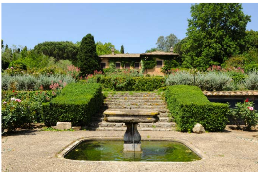
Figura 7 La fontana

Ad interrompere il rigore geometrico, troviamo un vialetto, quasi un sentiero volutamente “selvaggio” in cui prevalgono le specie arboree autoctone, più resistenti. E’ come se all’intervento dell’uomo sulla natura, in alcuni punti del giardino la natura abbia reagito mostrando la propria forza e determinazione.