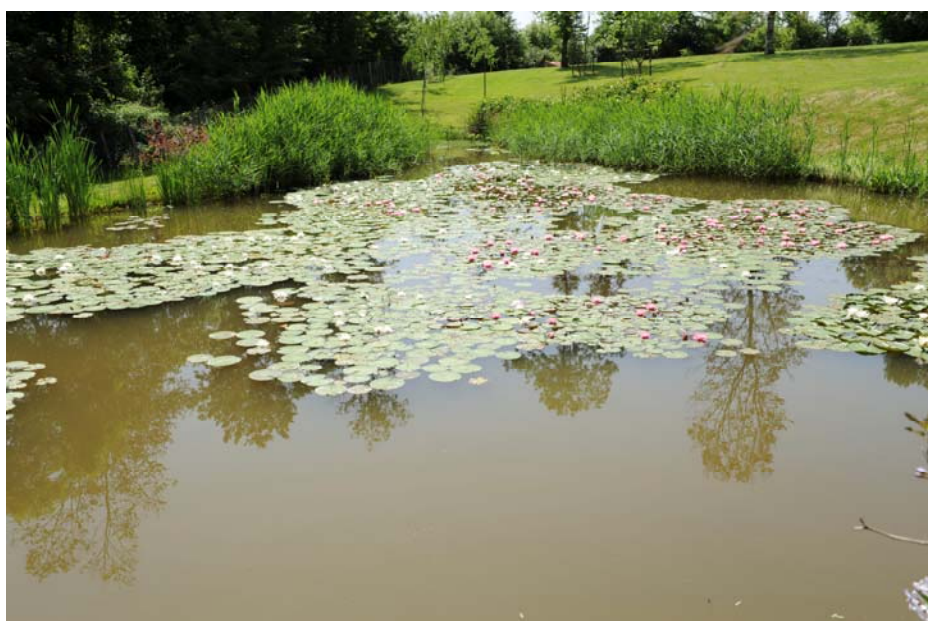
Figura 8 Il laghetto Figura 9 Il liquidambar

così scriveva Russell Page nel suo libro di “Memorie di un giardiniere” e questo giardino costituisce un ulteriore conferma alle sue parole.