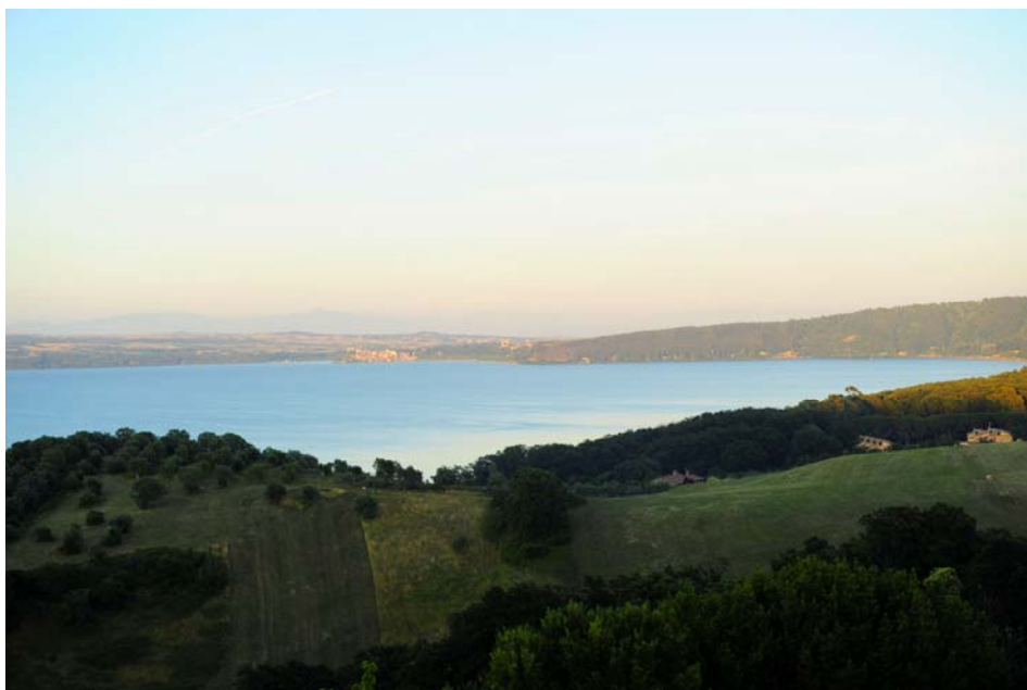
Figura 12 Il paesaggio

Fiori, colori, campagna, strade e giardini si fondono in un paesaggio affacciato sul lago e lasciano il passo al rosso fuoco di cui si tingono le foglie del giardino al bruno dei campi arati, invitando a rimanere in casa, magari al caldo, in compagnia di un pezzetto di formaggio dal sapore antico, che con i suoi sentori ricorda l'erba, il carciofo ed i fiori di campo che circondano il lago.